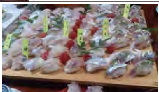
8月に開催したときの様子です。

12月の旬のお魚は、さわら・いわし・さば・はまち・かつお・やりいかなどです。当日は、どのようなお魚が獲れるのか楽しみにしてください。