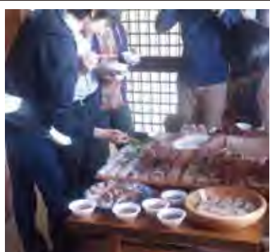
5月に開催したときの様子です。