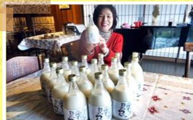
どぶろく「弥栄のろくさん」

日時 : 10月25日(土) 13:00～16:00 集合場所 : 農家民泊「温古里(ほっこり)」 参加費 : 2,000円 定員 : 10名