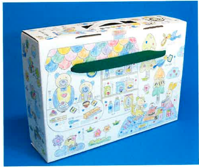
左：ぬり絵 ハザードマップ 右：ぬり絵 防災グッズ 上：ぬり絵前 下：ぬり絵後